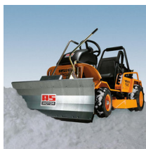
AS Motor 915 / 940 lumilevy